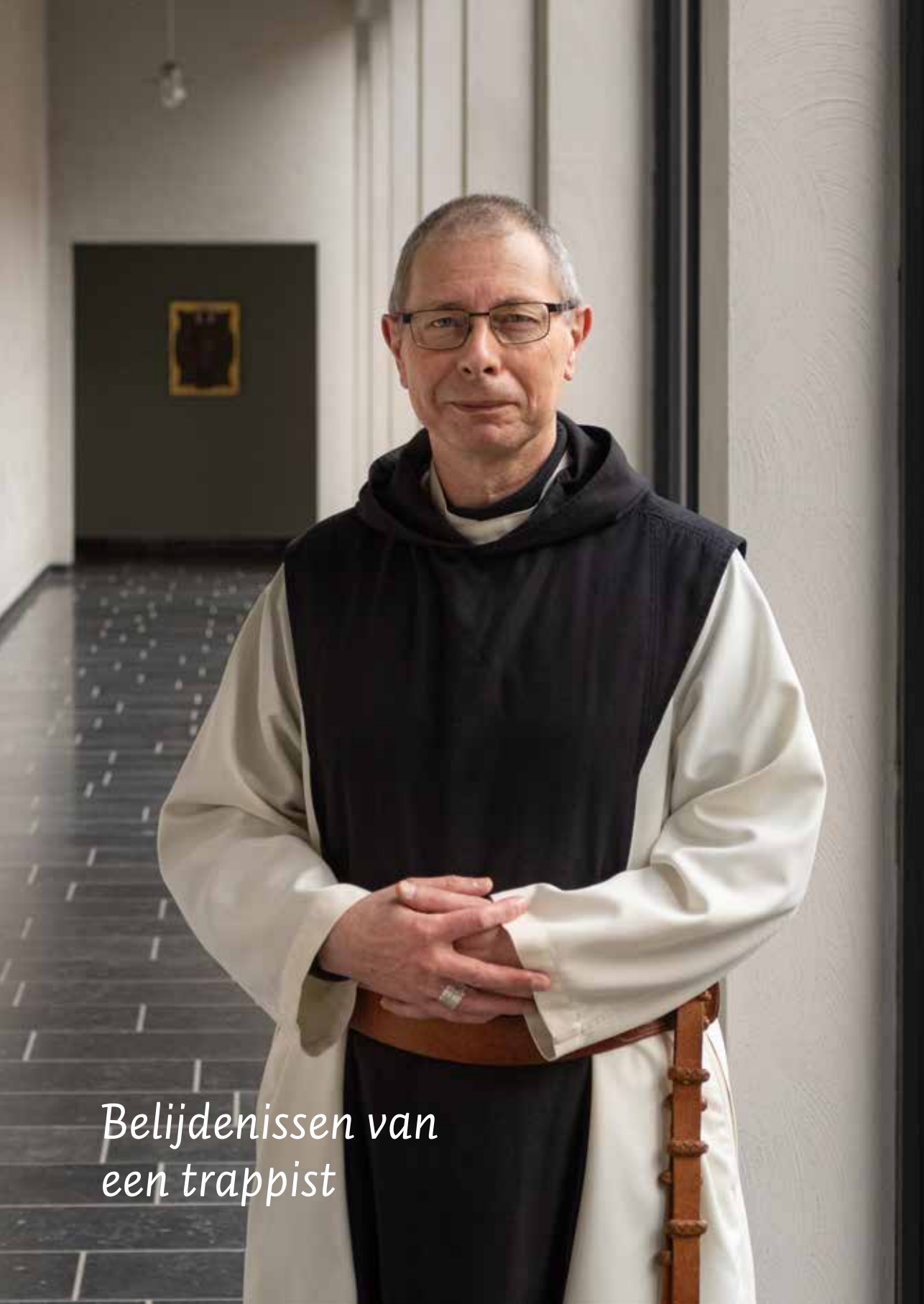
Belijdenissen van een trappist