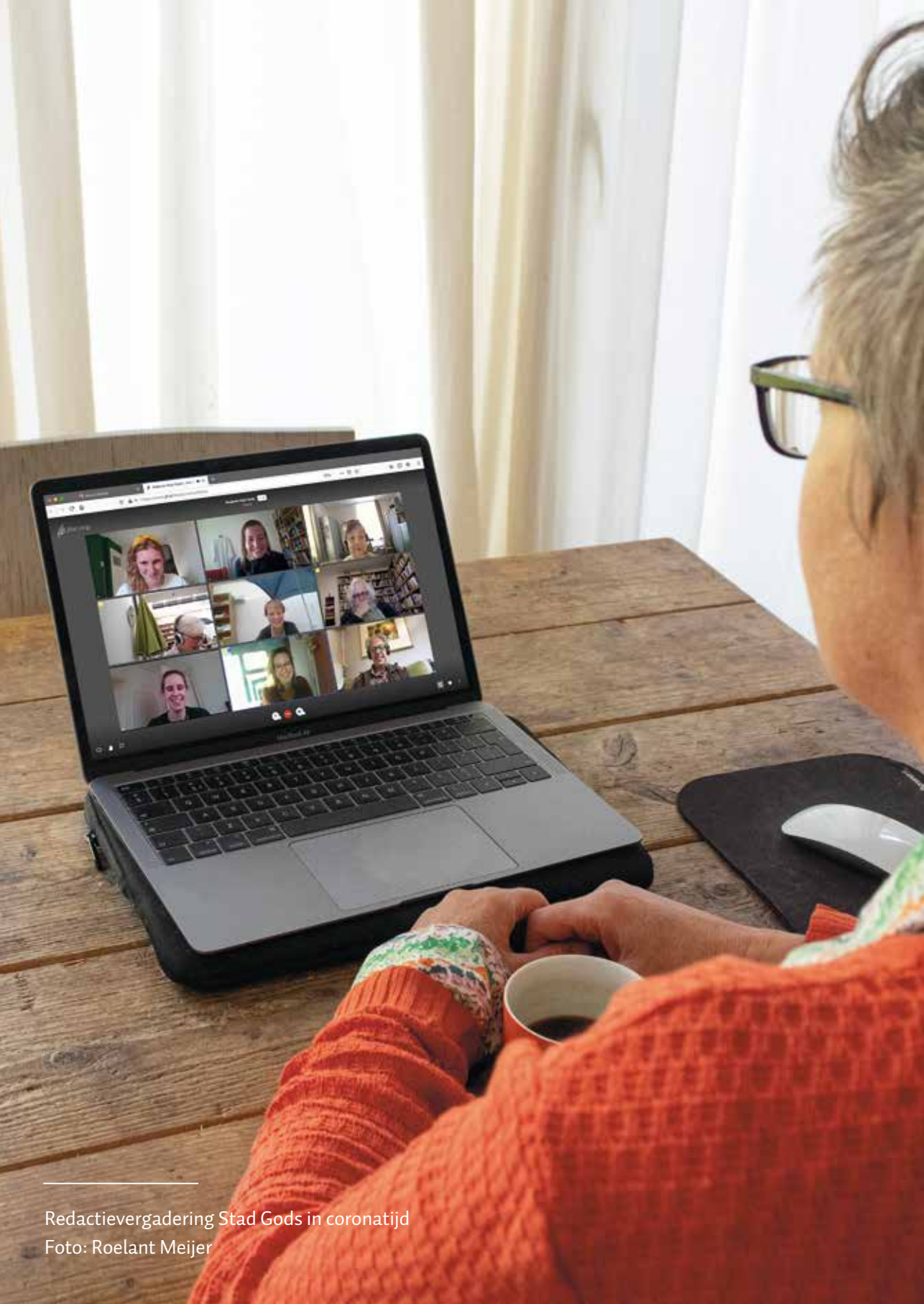
Redactievergadering Stad Gods in coronatijd