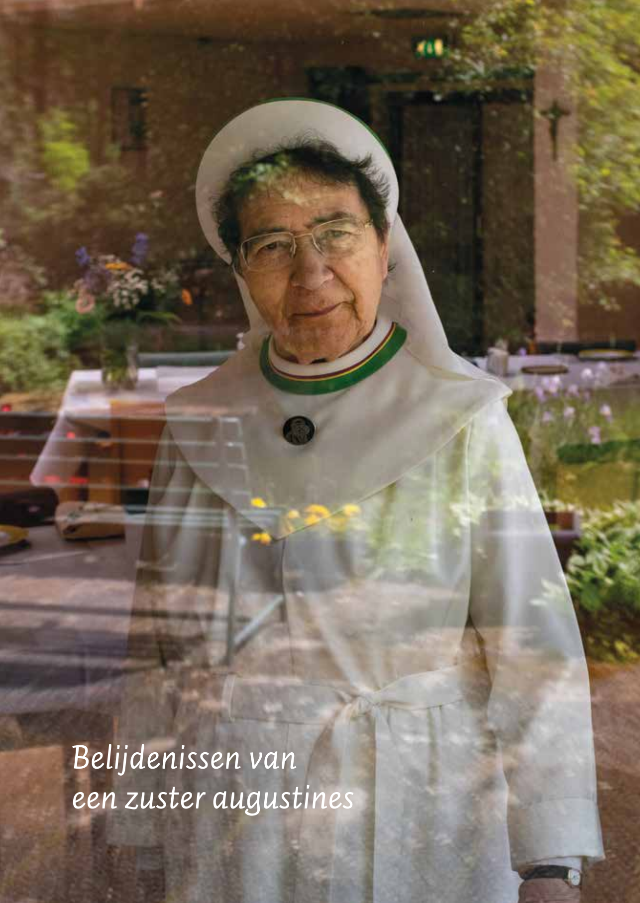
Belijdenissen van een zuster augustines