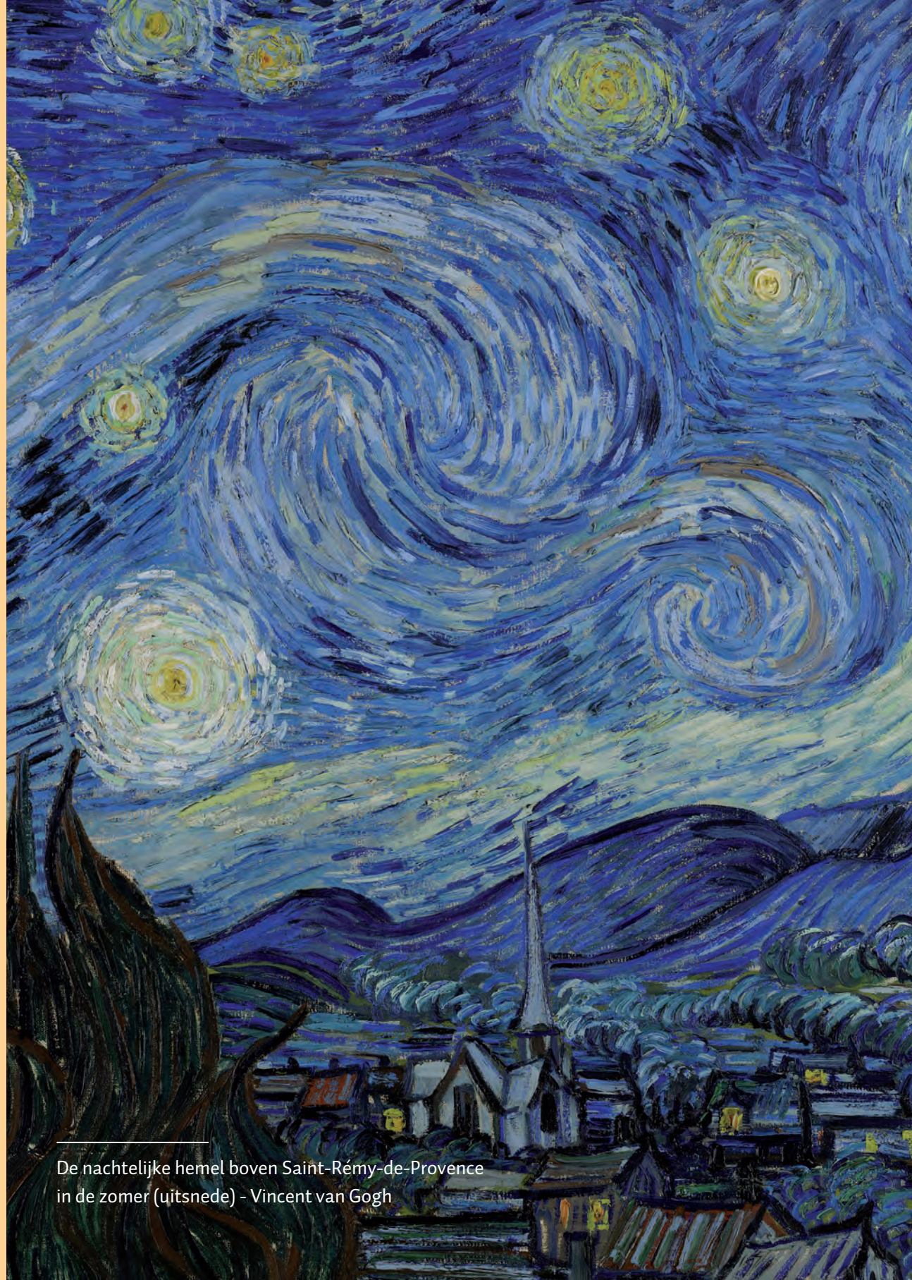
De nachtelijke hemel boven Saint-Rémy-de-Provence in de zomer (uitsnede) - Vincent van Gogh

Vrienden van de zusters augustinessen die ondersteunen met minimaal €10,00 per jaar, ontvangen Stad Gods automatisch. Als u dit blad ook wilt gaan lezen, maak genoemd bedrag dan over op NL76 INGB 0003 8244 29 ten name van Administratie tijdschrift Stad Gods Utrecht, onder vermelding van 'Nieuwe lezer', straat + huisnummer, postcode en plaats.